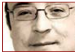
Agustín Vico Periodista

O somos capaces de distinguarnos de la máquina por nuestros contenidos, o dejará de tener sentido que pongamos nuestras manos sobre un teclado, porque el robot hará los refritos de copia y pega más rápi-